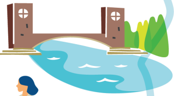
富岩運河 環水公園