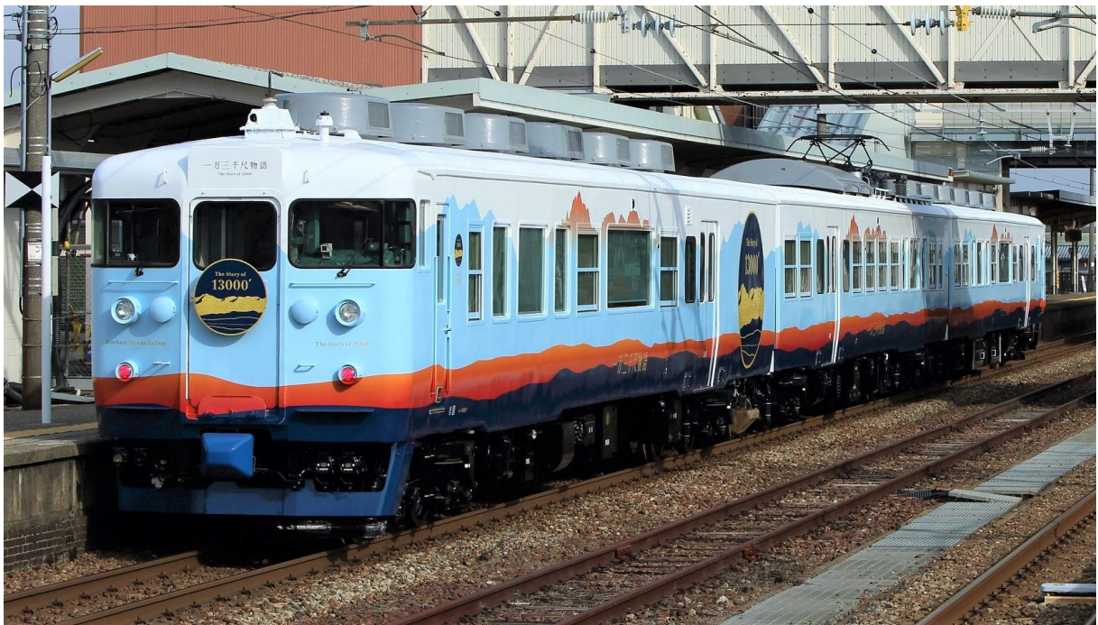
観光列車「一万三千尺物語」