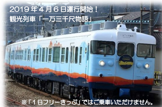
2019年4月6日運行開始！ 観光列車「一万三千尺物語」