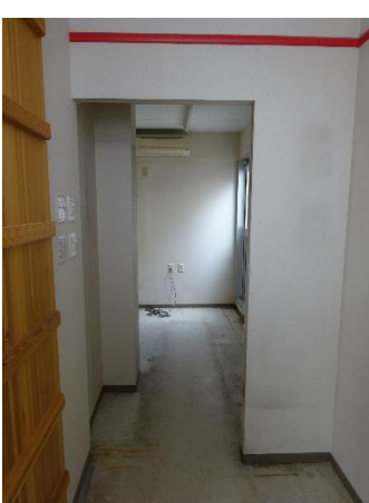
バックヤード (自動ドア付近)