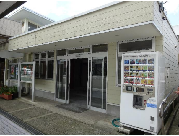
外観 (ロータリー側)