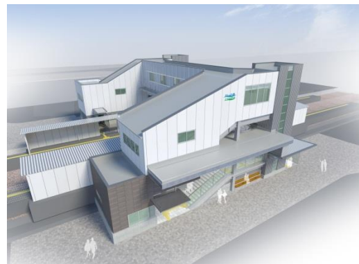
東側（木津土地区画整理事業区域側） 完成イメージ