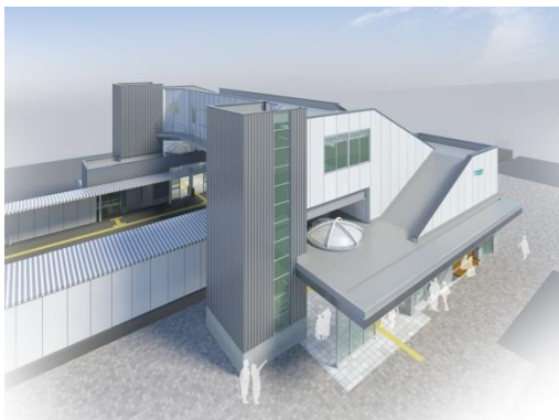
西側（羽広・和田側）完成イメージ